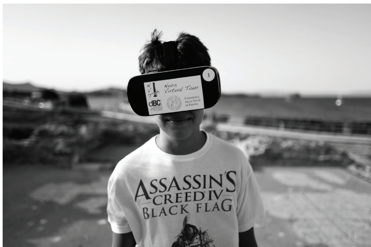
Fig. 1 - Un giovane visitatore del Parco Archeologico fruisce delle ricostruzioni 3D VR del Nora Virtual Tour all'interno della cella del Tempio romano.

La visita virtuale dell'antica Nora è oggi possibile: il Nora Virtual Tour non è più solo un dispositivo sperimentale ma è uno strumento collaudato a disposizione del Parco Archeologico e dei suoi utenti. L'Università degli Studi di Padova, ormai dal 2006, lavora in sinergia con la società Arcus/Ales s.p.a. di Roma per la realizzazione di una guida interattiva multimediale da fornire ai visitatori del sito, dotata di elevate potenzialità divulgative e di un alto contenuto scientifico 1 . Dopo quasi trent'anni di collaborazione reciproca e