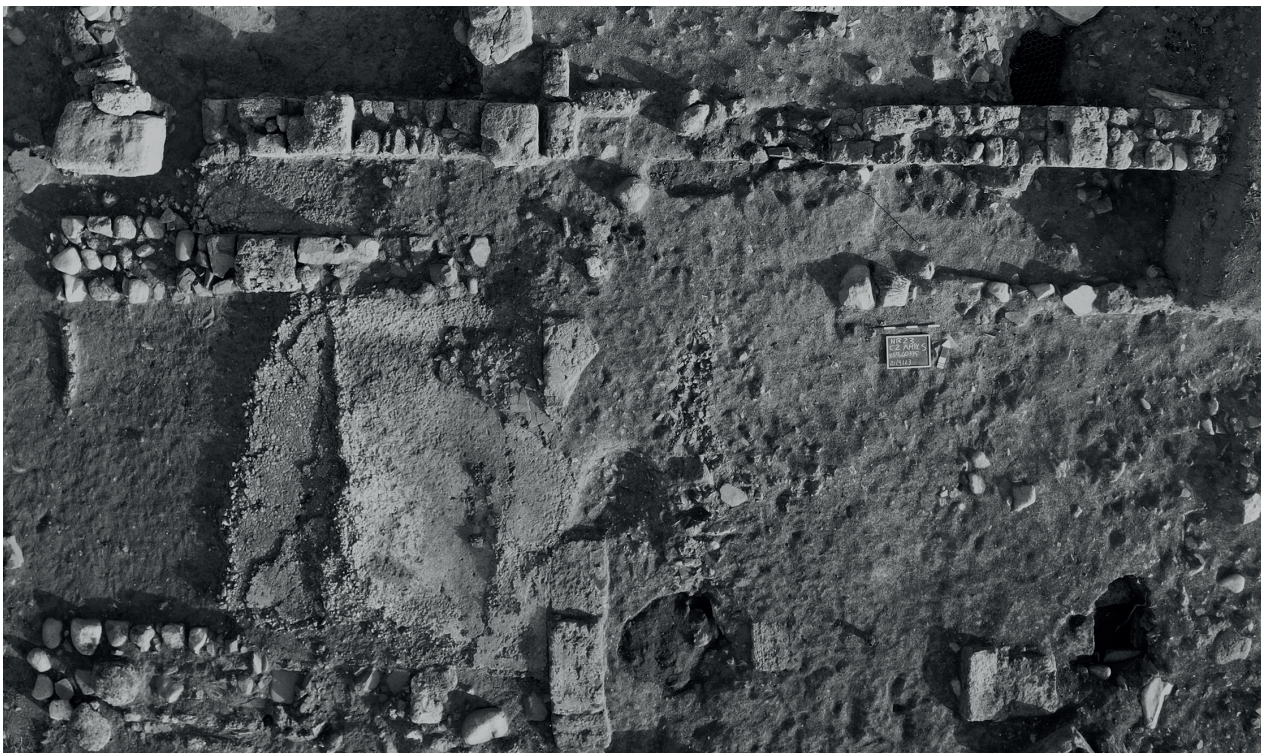
Fig. 5. Nora. Quartiere Occidentale: immagine zenitale del vano localizzato a est con la muratura in pietra USM 40335.

In posizione speculare verso sud è presente un vano di dimensioni più ampie ancora coperto dalle stratificazioni più recenti.