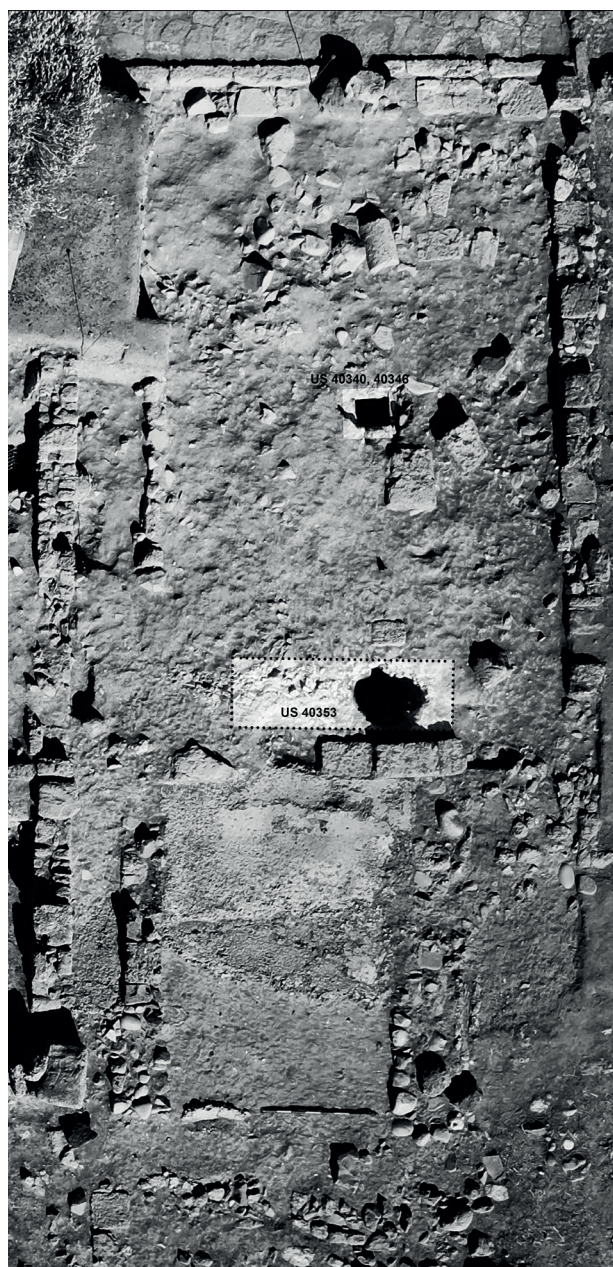
Fig. 3. Nora. Quartiere Occidentale: immagine zenitale dell'area Sud-Ovest del settore C2 con indicazione della cisterna a bagnarola (US 40353) e del probabile pozzo (US 40340, 40346).

Sulla base di queste evidenze si può ipotizzare che il primo vano era forse destinato ad uso commerciale, come lasciano ipotizzare la presenza sulla soglia di una serie di incisioni per l'alloggiamento di una porta a scorrimento e l'affaccio sul fronte della strada E-F. Il secondo vano, invece, era verosimilmente adibito ad uso residenziale come potrebbe suggerire la presenza degli intonaci dipinti. In questa fase, la cisterna US 40353 doveva essere forse ancora in uso. Non è chiaro al momento se una canaletta in malta (USR 40333) rinvenuta a sud di USM 40351 fosse collegata alla cisterna o ad un'altra struttura ipogea posta a ovest dell'area di scavo, la cui presenza sembra indiziata dal collasso della pavimentazione 40332.