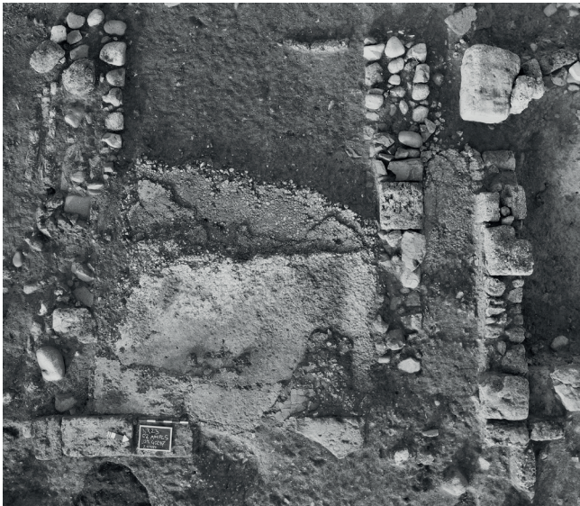
Fig. 4. Nora. Quartiere Occidentale: immagine zenitale del vano localizzato a ovest con i vari livelli di pavimentazione in cocchiopesto (USR 40287, 40331, 40332).