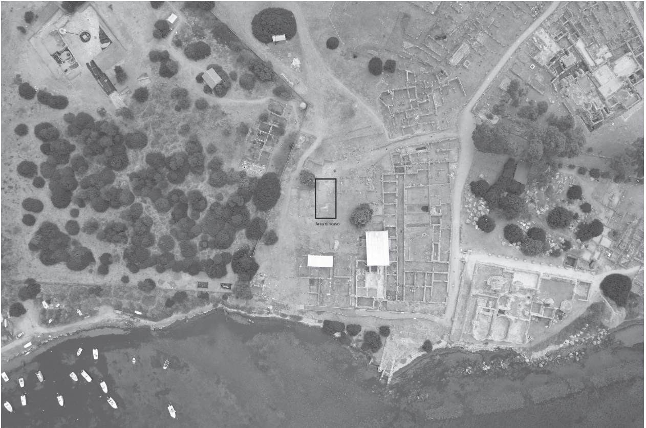
Fig. 1. Nora. Quartiere Occidentale: immagine da drone: nel riquadro è indicata l'area di scavo.