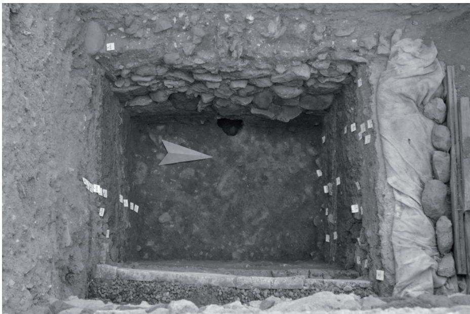
Fig. 2 - Nora, saggio PS4. L'area di scavo al termine della campagna di scavo 2014, vista da est; lungo la parete ovest il muro 34544, sul fondo il livello geologico 34577.